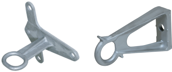
CS 10 W3