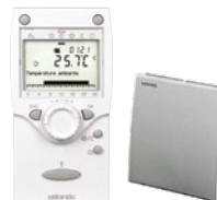
T78 (radio) réf. 074 061