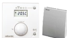
T58 (radio) réf. 075 313