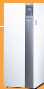
Axeo NOx Duo