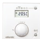
T55 réf. 073 951