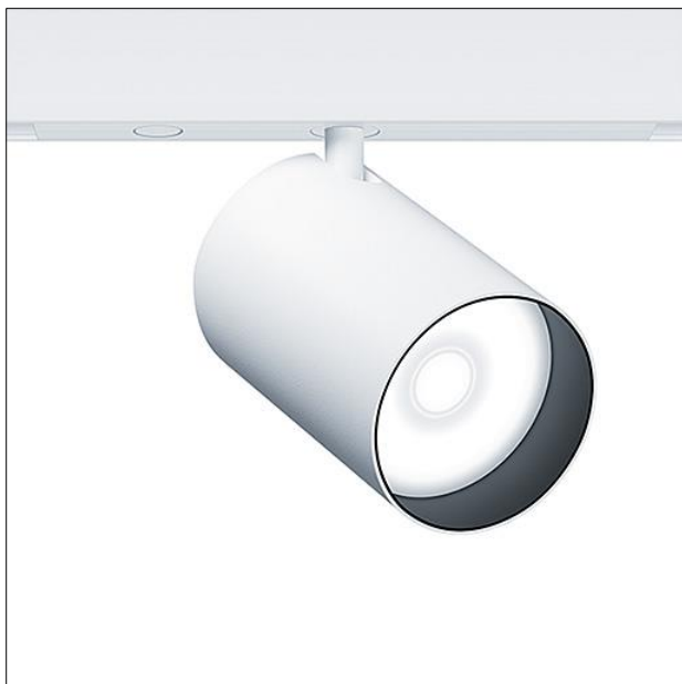
ZS SU2 F D65 whm.jpg