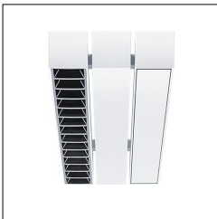
Projecteur à LED 1 x 14 SCENO 1X14 7000-830 SWI TEC SA WH 42188439