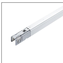
Rail porteur TEC2 T 2500-15 WH 22172610