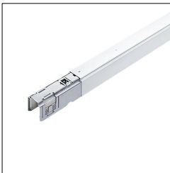
Rail porteur TEC2 T 2500-15 WH 22172610

La présente déclaration de produit environnemental (EPD) est basée selon les normes EN ISO 14025 et EN 15804 et décrit les impacts spécifiques environnementaux du produit mentionné. Cette déclaration fait suite également aux exigences spécifiques et concrètes du programme Institut Bauen und Umwelt e.V. (IBU) selon les règles de calcul des LCA et le contenu de l'EPD (de base) selon les instructions de PCR sous-jacentes (PCR: Règles de catégorie de produit) pour «Luminaires, lampes et composants pour luminaires» (Ref: IBU PCR Teil A et B). Le produit décrit sert d'unité déclarée. La déclaration inclut une description du produit, des informations sur la composition des matériaux, la production, le transport, la phase d'utilisation, l'élimination et le recyclage, ainsi que les résultats de l'évaluation du cycle de vie. Les EPD des produits de construction sont comparables uniquement si les valeurs sont calculées conformément au même PCR et des scénarios d'utilisation appropriés et obligatoires.