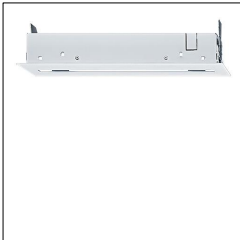
Luminaire de sécurité à pictogramme PURESIGN/COMSIGN 150 P MRC E1D SR 42186016