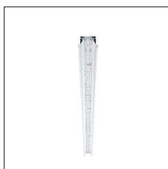
Réglette pour ligne lumineuse à LED SLN2-B 2500-840 L2000 PC/PCO/DD LDE 42189237