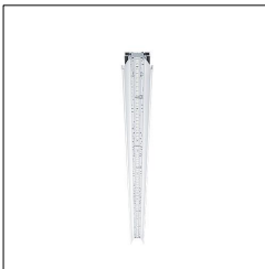
Réglette pour ligne lumineuse à LED SLN2-B 2500-840 L2000 PC/PCO/DD LDE 42189237

La présente déclaration de produit environnemental (EPD) est basée selon les normes EN ISO 14025 et EN 15804 et décrit les impacts spécifiques environnementaux du produit mentionné. Cette déclaration fait suite également aux exigences spécifiques et concrètes du programme Institut Bauen und Umwelt e.V. (IBU) selon les règles de calcul des LCA et le contenu de l'EPD (de base) selon les instructions de PCR sous-jacentes (PCR: Règles de catégorie de produit) pour «Luminaires, lampes et composants pour luminaires» (Ref: IBU PCR Teil A et B). Le produit décrit sert d'unité déclarée. La déclaration inclut une description du produit, des informations sur la composition des matériaux, la production, le transport, la phase d'utilisation, l'élimination et le recyclage, ainsi que les résultats de l'évaluation du cycle de vie. Les EPD des produits de construction sont comparables uniquement si les valeurs sont calculées conformément au même PCR et des scénarios d'utilisation appropriés et obligatoires.