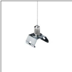
Suspension à câble TECTON/CONTUS ASI5 O-L 22169180