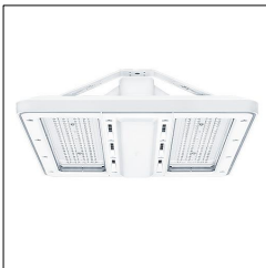
Luminaire industriel à LED CR2PL M17k-840 CH WB LDO WH 42187568