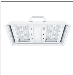
Luminaire industriel à LED CR2 M17k-840 PC WB EVG WH 42187627

La présente déclaration de produit environnemental (EPD) est basée selon les normes EN ISO 14025 et EN 15804 et décrit les impacts spécifiques environnementaux du produit mentionné. Cette déclaration fait suite également aux exigences spécifiques et concrètes du programme Institut Bauen und Umwelt e.V. (IBU) selon les règles de calcul des LCA et le contenu de l'EPD (de base) selon les instructions de PCR sous-jacentes (PCR: Règles de catégorie de produit) pour «Luminaires, lampes et composants pour luminaires» (Ref: IBU PCR Teil A et B). Le produit décrit sert d'unité déclarée. La déclaration inclut une description du produit, des informations sur la composition des matériaux, la production, le transport, la phase d'utilisation, l'élimination et le recyclage, ainsi que les résultats de l'évaluation du cycle de vie. Les EPD des produits de construction sont comparables uniquement si les valeurs sont calculées conformément au même PCR et des scénarios d'utilisation appropriés et obligatoires.