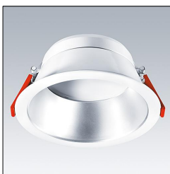
Downlight LED CHAL 200 LED1400-840 HF RSB 96629020

La présente déclaration de produit environnemental (EPD) est basée selon les normes EN ISO 14025 et EN 15804 et décrit les impacts spécifiques environnementaux du produit mentionné. Cette déclaration fait suite également aux exigences spécifiques et concrètes du programme Institut Bauen und Umwelt e.V. (IBU) selon les règles de calcul des LCA et le contenu de l'EPD (de base) selon les instructions de PCR sous-jacentes (PCR: Règles de catégorie de produit) pour «Luminaires, lampes et composants pour luminaires» (Ref: IBU PCR Teil A et B). Le produit décrit sert d'unité déclarée. La déclaration inclut une description du produit, des informations sur la composition des matériaux, la production, le transport, la phase d'utilisation, l'élimination et le recyclage, ainsi que les résultats de l'évaluation du cycle de vie. Les EPD des produits de construction sont comparables uniquement si les valeurs sont calculées conformément au même PCR et des scénarios d'utilisation appropriés et obligatoires.