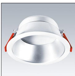
Downlight LED CHAL 200 LED1400-840 HF RSB 96629020