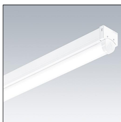
Plafonnier LED POPPACK LED 6000-840 HFI L1500 96631560