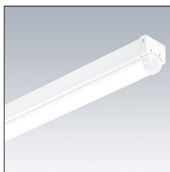
Plafonnier LED POPPACK LED 6000-840 HFI L1500 96631560

La présente déclaration de produit environnemental (EPD) est basée selon les normes EN ISO 14025 et EN 15804 et décrit les impacts spécifiques environnementaux du produit mentionné. Cette déclaration fait suite également aux exigences spécifiques et concrètes du programme Institut Bauen und Umwelt e.V. (IBU) selon les règles de calcul des LCA et le contenu de l'EPD (de base) selon les instructions de PCR sous-jacentes (PCR: Règles de catégorie de produit) pour «Luminaires, lampes et composants pour luminaires» (Ref: IBU PCR Teil A et B). Le produit décrit sert d'unité déclarée. La déclaration inclut une description du produit, des informations sur la composition des matériaux, la production, le transport, la phase d'utilisation, l'élimination et le recyclage, ainsi que les résultats de l'évaluation du cycle de vie. Les EPD des produits de construction sont comparables uniquement si les valeurs sont calculées conformément au même PCR et des scénarios d'utilisation appropriés et obligatoires.