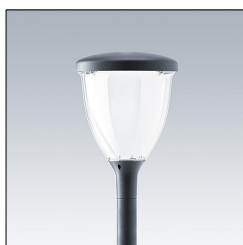
Luminaire urbain à LED porté VO 12L35-730 U1 SC CL2 W5 T60 ANT 96632678