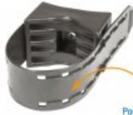
BIC 50-90 AM

Possibilité de cerclage feuillard autour du collier. Utilisation particulièrement adaptée pour les têtes de support.