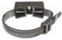
BIC 30-50 BIC 50-90