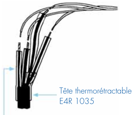
Tête thermorétractable E4R 1035