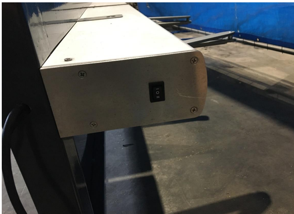
Photo C.3: Vue au niveau de la flasque latérale de l'opérateur maître installé sur un bloc-porte à 2 vantaux (vue au niveau du bouton de sélection du mode de fonctionnement)