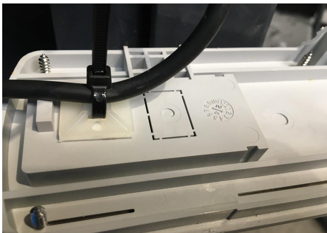
Photo C.4: Vue au niveau d'un dispositif d'arrêt de traction (patte support collée à l'intérieur de la flasque latérale et maintien du câble par l'intermédiaire d'un collier de serrage)