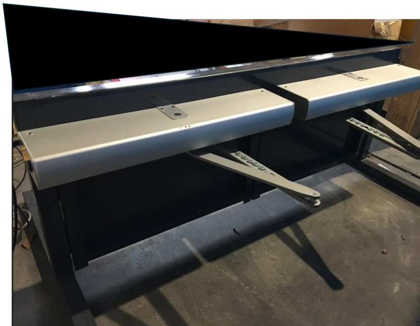
Photo C.1: Vue d'un bloc-porte battant à 2 vantaux sans recouvrement équipé des opérateurs A952