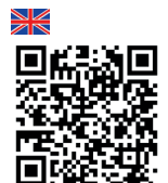
Video Blade exchange