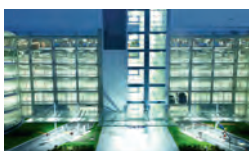
Parkings / Garages

RESISTO, tout simplement IRRESISTIBLE en toutes circonstances !