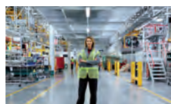
Zones de stockage