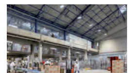
Usines / Industries