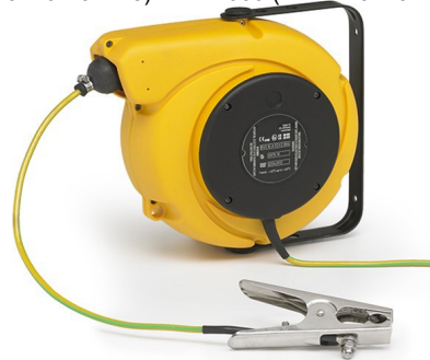
Enrouleur livré avec : - 10m de câble 1x10mm 2 - pince : ouverture jusqu'à 45mm Code ERATX0110-10P-P6