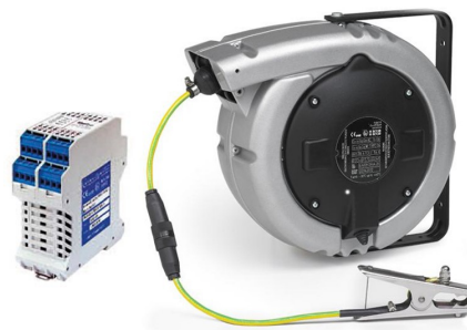
Enrouleur livré avec : - 20 mètres - Câble 1x4mm 2 + 2x1 mm 2 Code ERATX1421-20A-A7