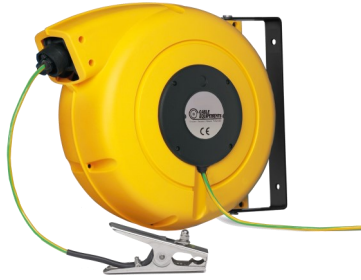
Enrouleur livré avec : - 20m de câble 1x10mm 2 - Pince : ouverture jusqu'à 45mm Code ERATX0110-20P-P8