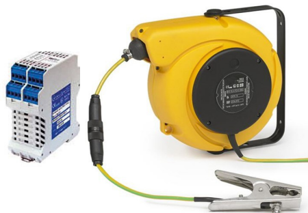
Enrouleur livré avec : - 10 mètres - Câble 1x4mm 2 + 2x1 mm 2 Code ERATX1421-10P-P6

L'utilisation d'un câble différent de celui fourni initialement invalidera l'homologation ATEX du système