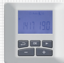
NANTUA 3 ÉOLE