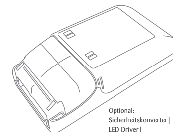
Optional: Sicherheitskonverter | LED Driver | Convertisseur de sécurité

Diese Montageanleitung entspricht unserem derzeitigen Kenntnisstand und unterliegt der Überarbeitung, sobald sich neue Erkenntnisse und Erfahrungen ergeben. | These assembly instructions are based on our current state of knowledge. They may be revised with the emergence of new facts or experiences. | La présente notice de montage a été rédigée sur la base de nos connaissances actuelles. Elle peut être modifiée suite à l'apparition de nouvelles connaissances et expériences.