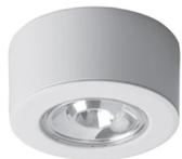
Embout pour montage en surface