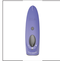
A1545 : Scanner de codes-barres et QR codes bluetooth