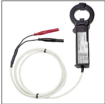
A1579 : Pince de courant de fuite