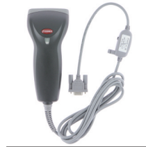
A1105 : Scanner de codes-barres