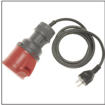
A1317 : Adaptateur triphasé 32A