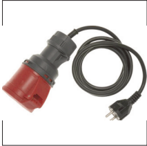
A1316 : Adaptateur triphasé 16A