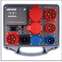
A1422 : Adaptateur triphasé actif