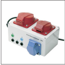
A1207 : Adaptateur triphasé