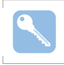
P1101 : Licence PRO pour MESM