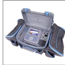
A1550 : Grand sac de transport