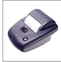
A1488 : Imprimante Bluetooth®