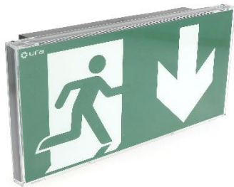
BAES d'évacuation URALIFE V noir adressable pose murale réf. UR118319V