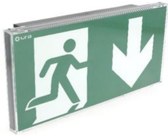
BAES DBR URALIFE V noir adressable pose murale réf. UR118359V