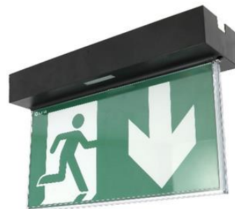
BAES d'évacuation URALIFE V noir adressable pose plafond encastrée ou saillie réf. UR118419V