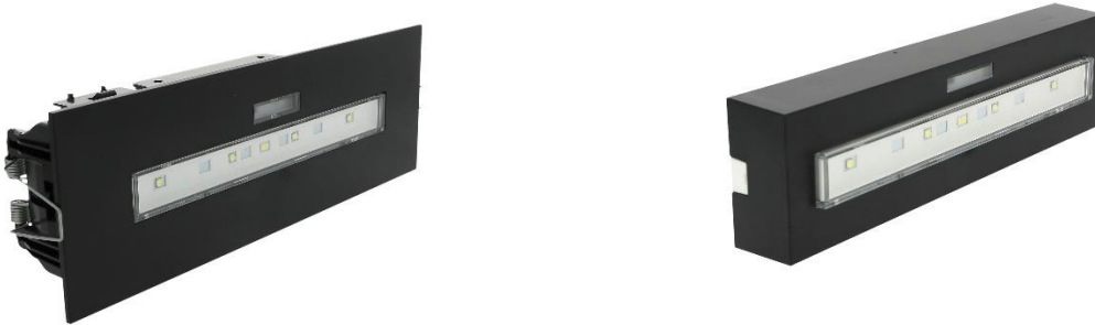
BAES d'ambiance URALIFE V noir adressable pose plafond encastrée ou saillie réf. UR118429V