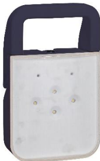
BAPI Leds réf. 114 002