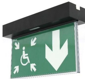
BAES DBR URALIFE V noir adressable pose plafond encastrée ou saillie réf. UR118459V