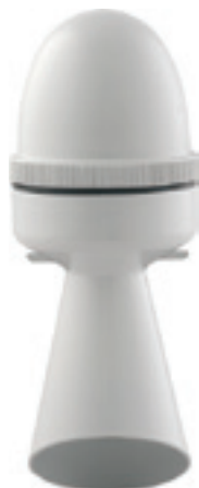
SEM SEM PLUS