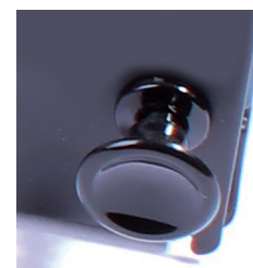
Clip de verrouillage de la façade.