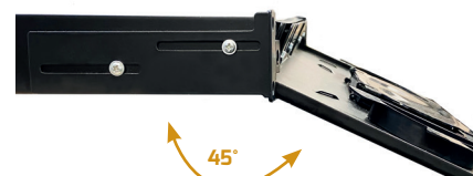
Tiroir coulissant et inclinable à 45°