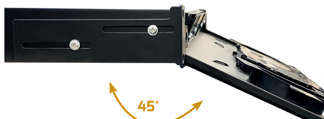
Tiroir coulissant et inclinable à 45°