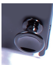
Clip de verrouillage de la façade.