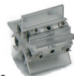
Connectique DBC-2C 5 x 1,5 à 6mm 2 , mono ou multibrins souple ou rigide