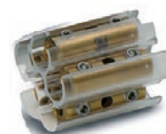
Connectique DBC-3C 5 x 2,5 à 16mm 2 , mono ou multibrins souple ou rigide