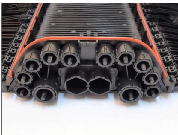
BPEO Boîtier de Protection d'épissures optiques, Point de distribution d'extrémité de taille 3 avec un câble express et pour un maximum de 12 câbles de dérivation. Organisateur pouvant contenir jusqu'à 48 plateaux d'épissures.