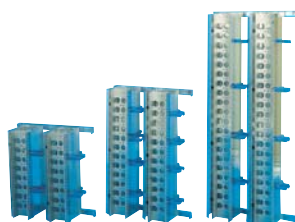
Ferme RIBE EUROPE