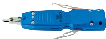
Outil de connexion