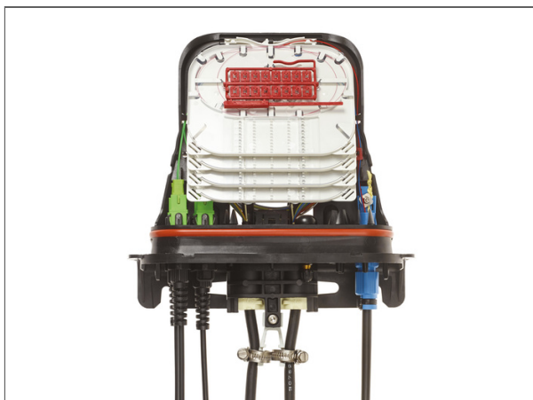
BPEO Boîtier de Protection d'épissures optiques, Taille 0 ECAM Connect 4 Ports SC APC (embout à contact physique angulaire)