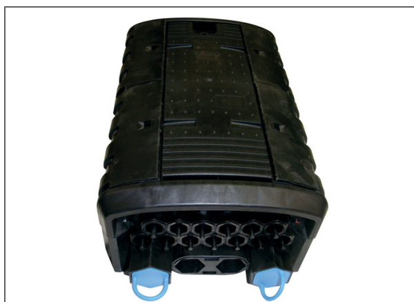
BPEO Boîtier de Protection d'épissures optiques, Taille 1.5 ECAM Connect 12 ports SC APC

Les boîtiers de protection d'épissures optiques BPEO sont conçus pour protéger la fibre. Ils sont utilisés dans de nombreuses applications. Disponibles dans différentes tailles, ils peuvent être déployés en aérien (poteau, façade) ou souterrain (regard, puits de raccordement). Ces boîtiers sont utilisés pour des installations fibre à domicile (FTTH) et tout type de déploiement de câble fibre optique. Facile à ouvrir et réouvrir, le mécanisme de verrouillage mécanique du dispositif de fermeture du BPEO est rapide et facile à mettre en œuvre, ne nécessitant aucun outillage spécifique. L'association du joint et du système de fermeture garantissent l'étanchéité à l'eau. Préparation externe du câble : le système ECAM a été conçu pour permettre aux câbles d'être préparés et maintenus en dehors du boîtier pour un maximum de protection.