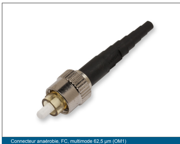
Connecteur anaérobie, FC, multimode 62,5 µm (OM1)

Front and rear security in network panel