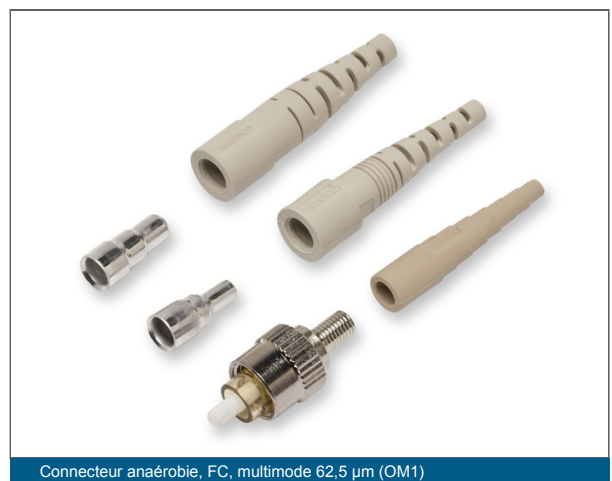
Connecteur anaérobie, FC, multimode 62,5 µm (OM1)