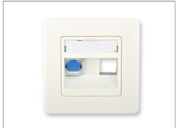
Plaque murale Everon® Datacom cuivre, 3 ports, inclinée, pour jusqu'à trois prises Everon® Datacom cuivre xs500 Keystone, 50x50 mm, blanc