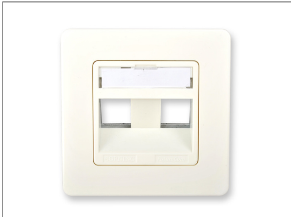
Plaque murale Everon® Datacom cuivre, 3 ports, inclinée, pour jusqu'à trois prises Everon® Datacom cuivre xs500 Keystone, 50x50 mm, blanc