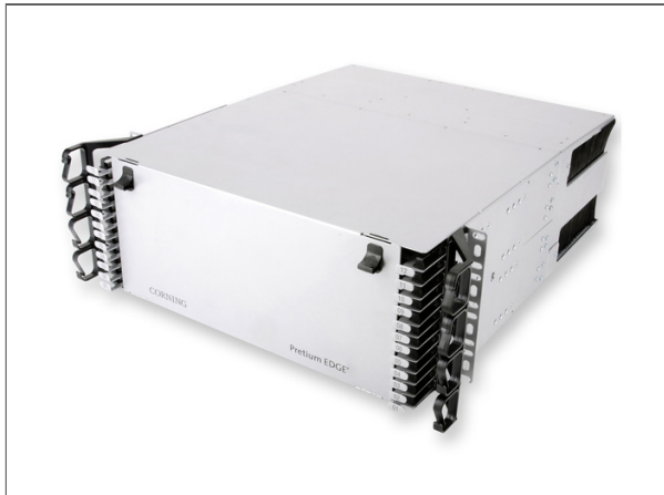
Gabinete EDGE™, 4 unités de rack, gris, pour 48 modules EDGE ou cassettes.