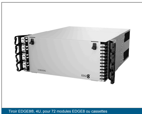
Tiroir EDGE8®, 4U, pour 72 modules EDGE8 ou cassettes