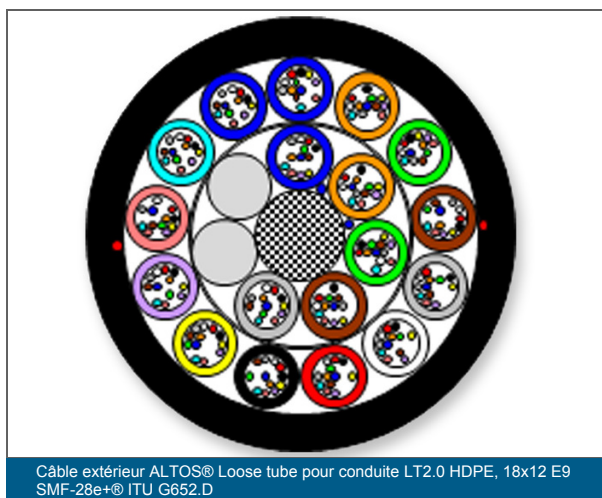
Câble extérieur ALTOS® Loose tube pour conduite LT2.0 HDPE, 18x12 E9 SMF-28e+® ITU G652.D

ce qui permet une préparation rapide et aisée des câbles dans les installations en extérieur