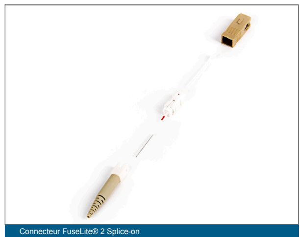
Connecteur FuseLite® 2 Splice-on