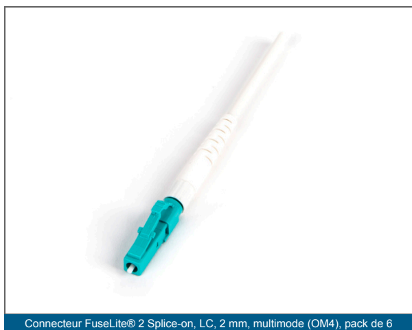
Connecteur FuseLite® 2 Splice-on, LC, 2 mm, multimode (OM4), pack de 6

Offrir une flexibilité pour les réparations et le rétablissement de la connectivité