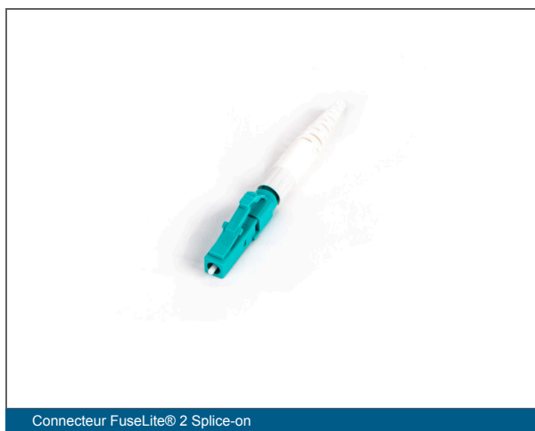
Connecteur FuseLite® 2 Splice-on

Offrir une flexibilité pour les réparations et le rétablissement de la connectivité