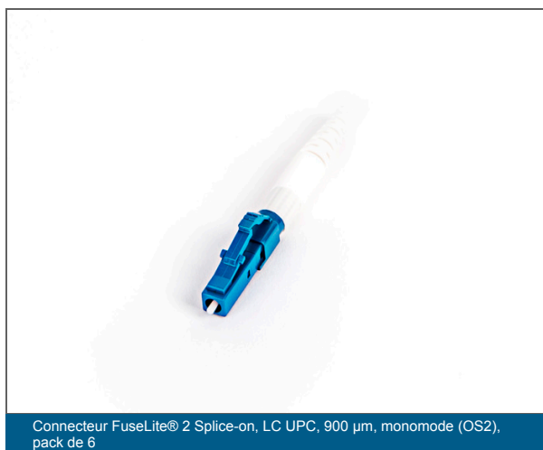
Connecteur FuseLite® 2 Splice-on, LC UPC, 900 µm, monomode (OS2), pack de 6

Offrir une flexibilité pour les réparations et le rétablissement de la connectivité