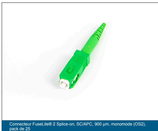
Connecteur FuseLite® 2 Splice-on, SC/APC, 900 µm, monomode (OS2), pack de 25

Offrir une flexibilité pour les réparations et le rétablissement de la connectivité