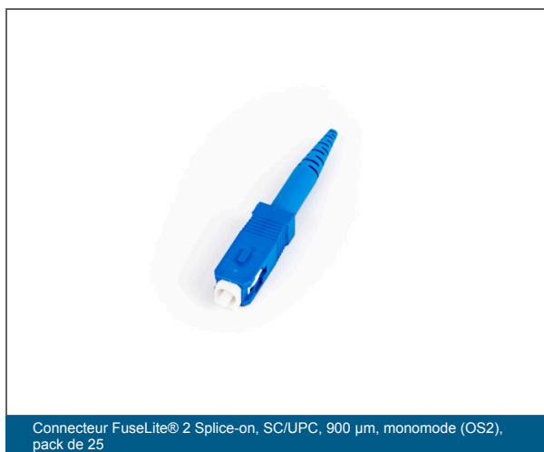
Connecteur FuseLite® 2 Splice-on, SC/UPC, 900 µm, monomode (OS2), pack de 25

Offrir une flexibilité pour les réparations et le rétablissement de la connectivité