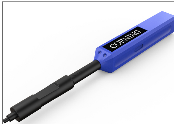
Accessoires de nettoyage des fibres optiques, Nettoyant pour ports de connectivité renforcés Evolv® avec technologie Pushlok®