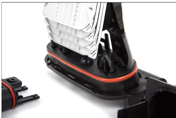
BPEO Boîtier de Protection d'épissures optiques, Taille 0 avec 6 ECAM Épissures S6 préinstallées, 1 ECAM D18, Kit Scellage 6/9mm, 1 plateau d'épissures 12FO