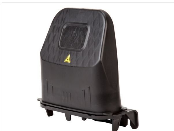
BPEO Boîtier de Protection d'épissures optiques, Taille 0 avec 6 ECAM Épissures S6 préinstallées, 1 ECAM D18, Kit Scellage 6/9mm, 1 plateau d'épissures 12FO

Les boîtiers de protection d'épissures optiques BPEO sont conçus pour protéger la fibre. Ils sont utilisés dans de nombreuses applications. Disponibles dans différentes tailles, ils peuvent être déployés en aérien (poteau, façade) ou souterrain (regard, puits de raccordement). Ces boîtiers sont utilisés pour des installations fibre à domicile (FTTH) et tout type de déploiement de câble fibre optique. Facile à ouvrir et réouvrir, le mécanisme de verrouillage mécanique du dispositif de fermeture du BPEO est rapide et facile à mettre en œuvre, ne nécessitant aucun outillage spécifique. L'association du joint et du système de fermeture garantissent l'étanchéité à l'eau. Préparation externe du câble : le système ECAM a été conçu pour permettre aux câbles d'être préparés et maintenus en dehors du boîtier pour un maximum de protection.