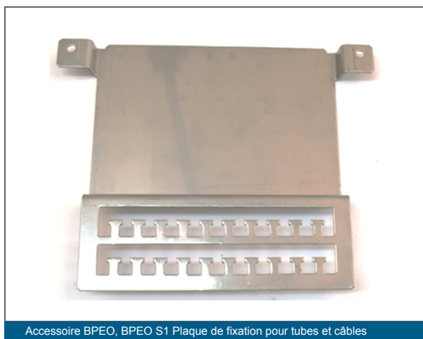
Accessoire BPEO, BPEO S1 Plaque de fixation pour tubes et câbles

Kit de mise à la terre, Diverses pièces plastiques pour fixer et guider les fibres dans les organisateurs de cassettes, Outil pour déclipper les ECAM des ports d'entrées des faces avant