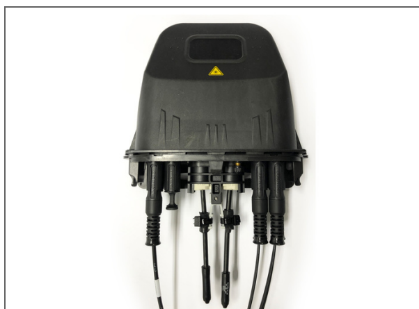
BPEO Boîtier de Protection d'épissures optiques, Taille 0 avec la technologie Evolv Pushlok, 4 ports avec 2 plateaux d'épissures, 4 adaptateurs SC APC

Les boîtiers de protection d'épissures optiques BPEO sont conçus pour protéger la fibre. Ils sont utilisés dans de nombreuses applications. Disponibles dans différentes tailles, ils peuvent être déployés en aérien (poteau, façade) ou souterrain (regard, puits de raccordement). Ces boîtiers sont utilisés pour des installations fibre à domicile (FTTH) et tout type de déploiement de câble fibre optique. Facile à ouvrir et réouvrir, le mécanisme de verrouillage mécanique du dispositif de fermeture du BPEO est rapide et facile à mettre en œuvre, ne nécessitant aucun outillage spécifique. L'association du joint et du système de fermeture garantissent l'étanchéité à l'eau. Préparation externe du câble : le système ECAM a été conçu pour permettre aux câbles d'être préparés et maintenus en dehors du boîtier pour un maximum de protection.