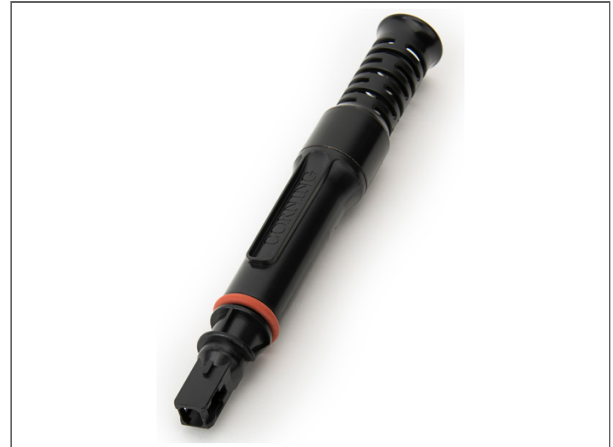
BPEO Boîtier de Protection d'épissures optiques, Taille 0 avec la technologie Evolv Pushlok, 8 ports avec 2 plateaux d'épissures, 8 adaptateurs SC APC