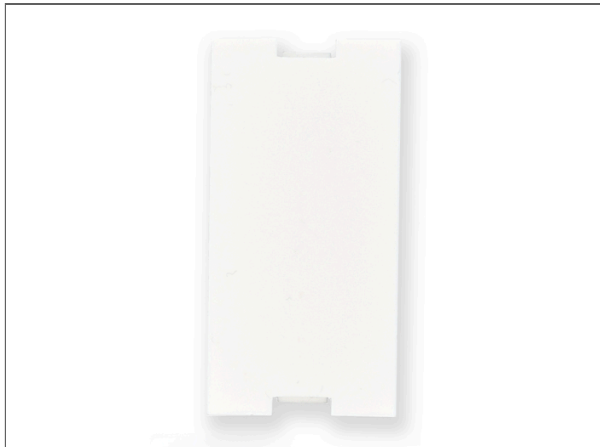
Everon® Cuivre Datacom Point de terminaison VOL et Keystone, Obturateur 45x45, 22,5x55mm, plat, blanc