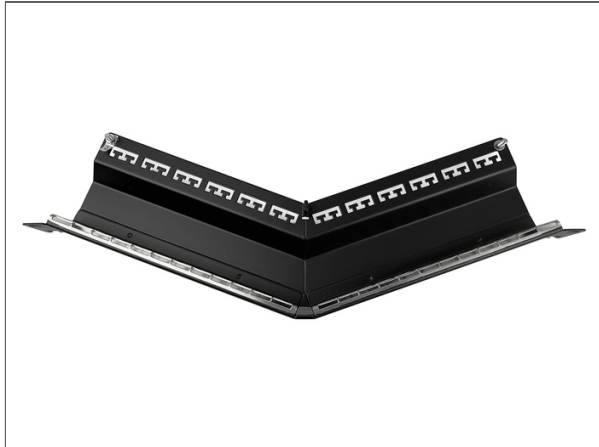
Everon® Copper DataCom, Panneau RJ45, Everon® Datennetzwerktechnik Verteilerfelder, 160° gewinkelt Verteilerfeld 19 Zoll 1U 24 Ports, VOL, Schwarz, leer